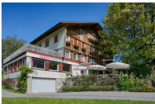
www.froheaussicht.ch Tel 0041 71 799 11 74