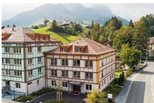
www.weissbadlodge.ch Tel 0041 71 798 80 80