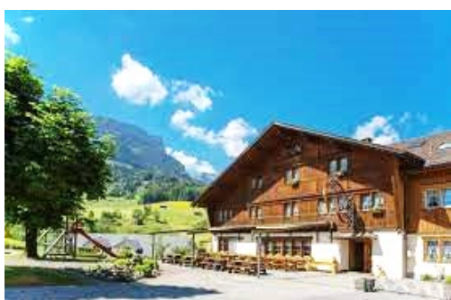
www.roessli-bruelisau.ch Tel 0041 71 799 11 04